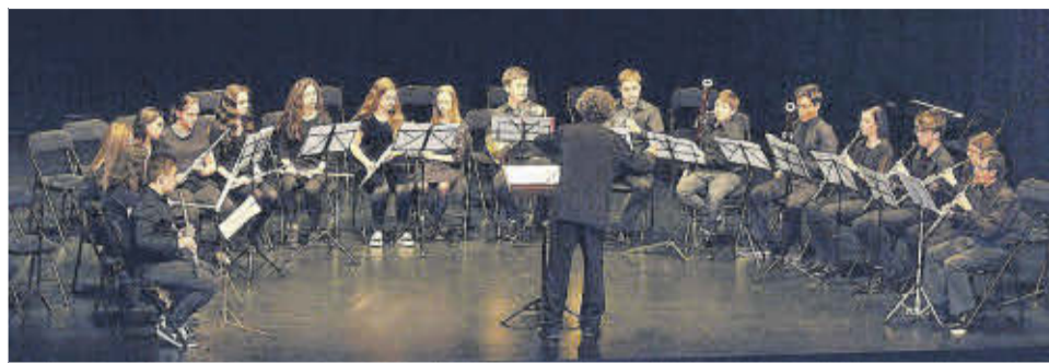
A la izquierda, miembros de Valnalón. A la derecha, la Orquesta de Viento del Conservatorio del Nalón.