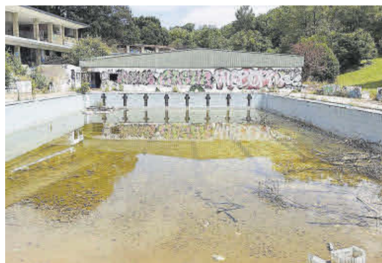
De arriba abajo, manifestación por las obras del soterramiento; trabajos de desmantelamiento de la térmica de Lada, y estado de las piscinas de Pénjamo.