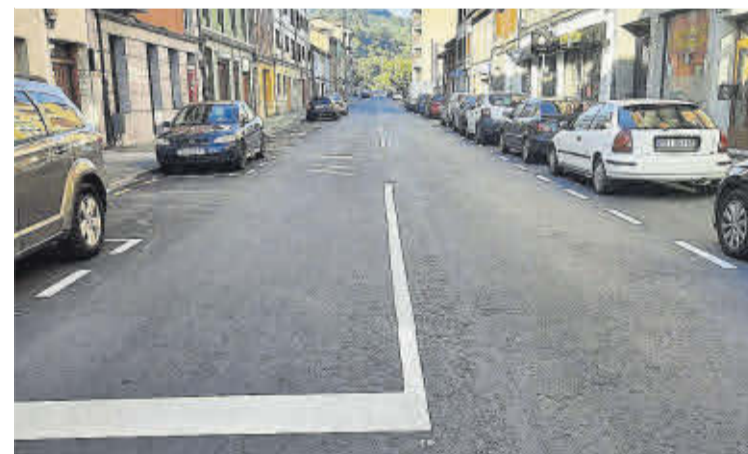
Arriba, pabellón de Langreo en la FIDMA. Abajo, asfaltado de una calle en Lada.

La Agrupación Socialista de Langreo desea a las vecinas y vecinos ¡FELICES FIESTAS!